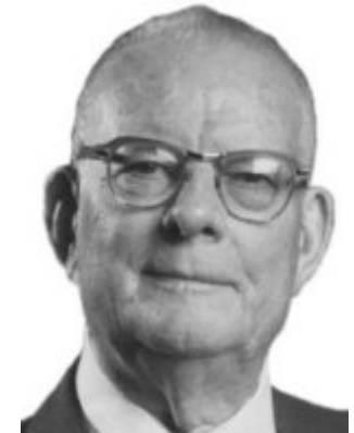
W Edwards Deming 1900-1993

Certainly we want good results, but management by results is not the way to get good results ... work on the causes of results.